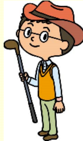
厚生労働省：国民生活基礎調査,2011