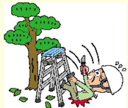
厚生労働省：国民生活基礎調査,2010